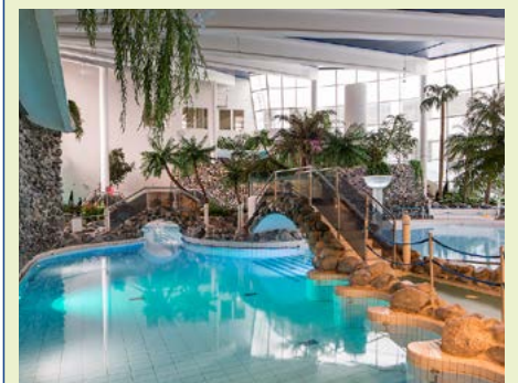
Im Spa-Bereich des Hotels