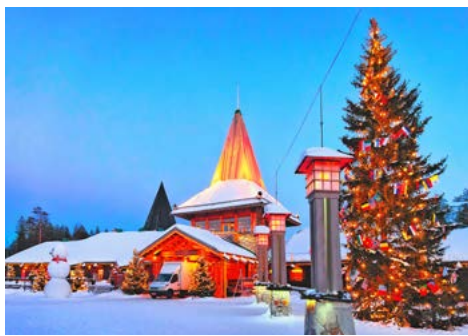
Postamt im Weihnachtsmandorf