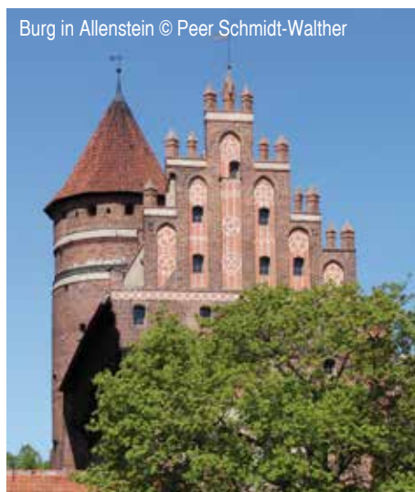
Burg in Allenstein

Am Vormittag unternehmen Sie einen Bummel durch Lötzen [Gicycko]. Sie sehen die nach Plänen des Hofarchitekten Schinkel erbaute Kirche. Dort finden jetzt wieder deutschsprachige Gottesdienste statt. Ein seltenes Technikdenkmal ist die handbetriebene Drehbrücke. Nach einem Besuch der Feste Boyen aus der