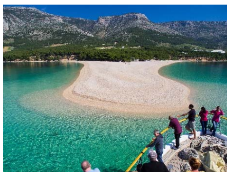
Strand Zlatni Rat – Bol, Insel Brač